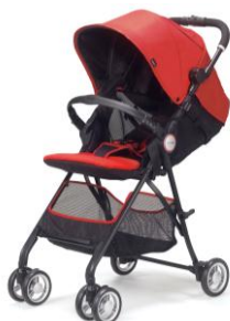
アクティブレッド