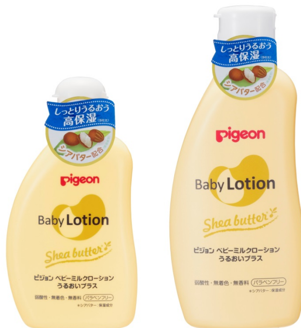
左から『ベビーミルクローション うるおいプラス』 120g、300g

ピジョン株式会社（本社：東京、社長：山下茂）は、乾燥する時期でもしっとりうるおう、シアバター(保湿成分)配合の高保湿ローション「ベビーミルクローション うるおいプラス」を2017年8月21日（月）に新発売いたします。