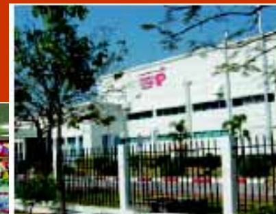
Pigeon Industries (Thailand) Co., Ltd.