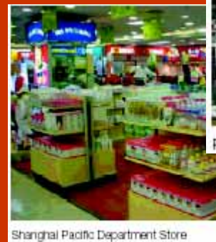
Shanghai Pacific Department Store