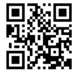
携帯電話 QR コード

※記念樹の所有権はピジョン(株)にあり、植樹に必要な苗木、地ごしらえ、植樹、下刈り等の作業費、木が生長するまでの維持管理費、施設費等はピジョンが全て負担します。