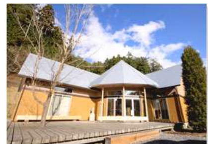
森のログハウス「すくすくハウス」