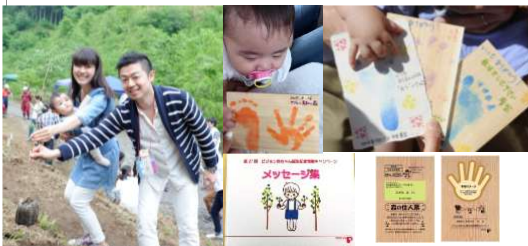
「未来のお子様へのメッセージ集」

また、ご応募の特典として、応募者 全員 に赤ちゃんの手形・足形を押せるヒノキで作ったハガキ「森の住人票」をプレゼントします。さらに、森のログハウス（すくすくハウス）に応募者全員のお名前が記された【植樹者名簿】、お寄せいただく未来のお子様へのメッセージを記載する【メッセージ集】を設置いたします。参加されたご家族は、いつでも「美和の森」に訪れていただき、自然に親しみながら、植えられた記念樹の生長をご覧いただけます。