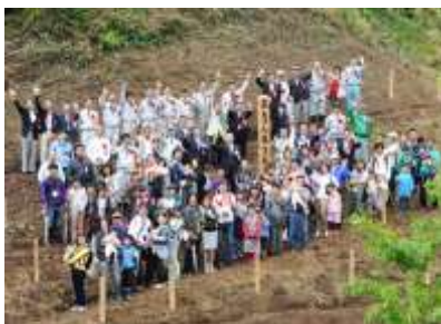
第 29 回 記念植樹の様子