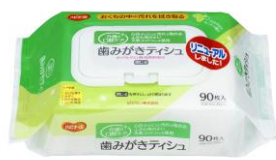
歯みがきティッシュ 90枚入