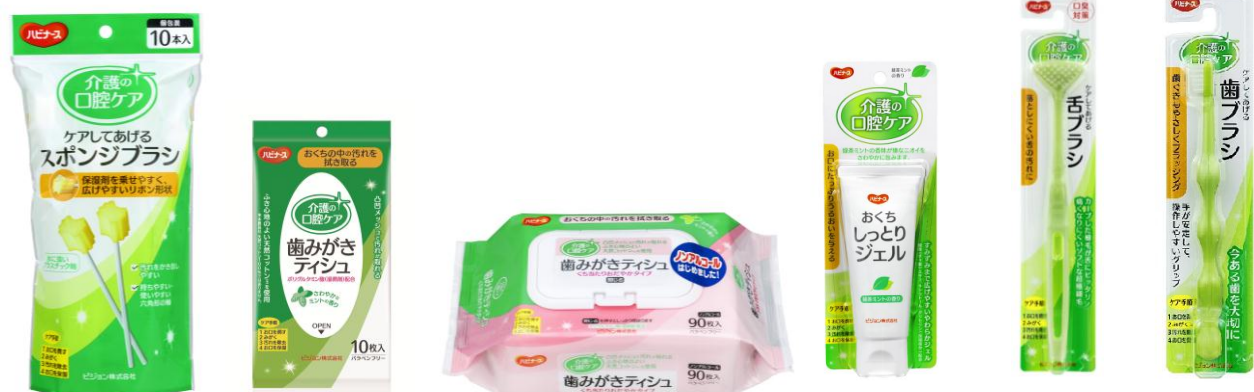
<介護の口腔ケアシリーズ>

口腔ケアの手軽さとケアの効果を重視した設計で、いつまでも、食べる楽しみを持ち続けられるように、毎日の口腔ケアを4つのステップでしっかりサポートします。