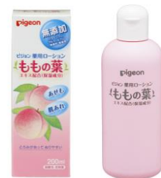
ピジョン薬用ローション(ももの葉)

今回発売する「ピジョン薬用全身泡ソープ(ももの葉)」は、「からだを洗う時にも肌あれを予防する」という新しい視点のスキンケア商品です。「ピジョン薬用ローション(ももの葉)」と合わせてご使用頂くことで、「洗って、うるおす」の2ステップで赤ちゃんの肌あれを防ぎ、お肌をすこやかに保つことができます。ピジョンは40年以上続くベビースキンケアのリーディングカンパニーとして、ママと赤ちゃんの新しいスキンケア習慣をご提案してまいります。