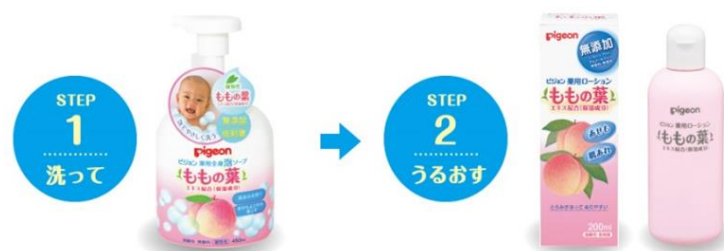
「洗って、うるおす」スキンケア習慣

今回発売する「ピジョン薬用全身泡ソープ(ももの葉)」は、「からだを洗う時にも肌あれを予防する」という新しい視点のスキンケア商品です。「ピジョン薬用ローション(ももの葉)」と合わせてご使用頂くことで、「洗って、うるおす」の2ステップで赤ちゃんの肌あれを防ぎ、お肌をすこやかに保つことができます。ピジョンは40年以上続くベビースキンケアのリーディングカンパニーとして、ママと赤ちゃんの新しいスキンケア習慣をご提案してまいります。