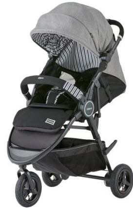
palskip グレイシーグレー