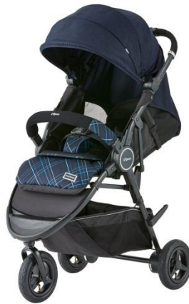
palskip オリビアネイビー