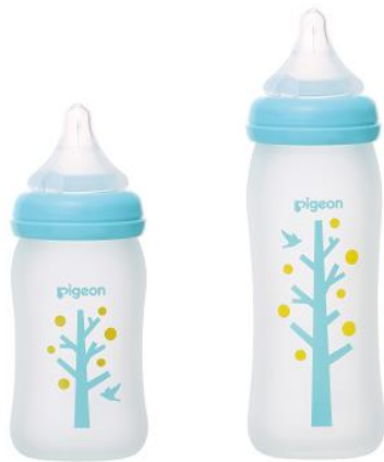
▲tree 柄(160ml/240ml) ※fruits 柄発売と同時に全国発売予定