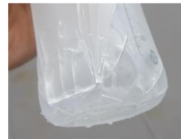
▲落下の衝撃を与えた母乳実感 ® Coating。ガラスが飛散しにくい。