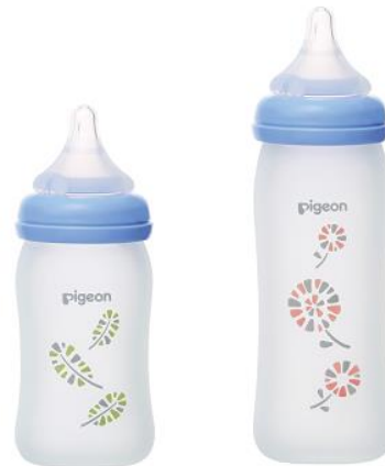
▲wind 柄 (羽は 160ml/花は 240ml) ※wind 柄は、赤ちゃん本舗のみの販売です。