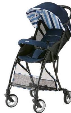
フレッシュネイビー