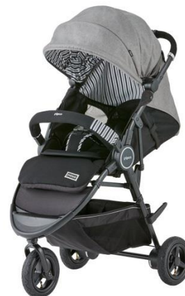
グレイシーグレー