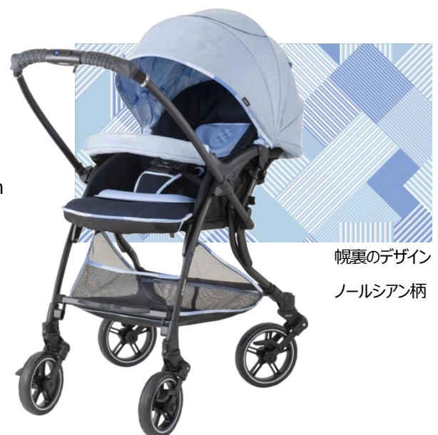
幌裏のデザイン ノールシアン柄

■一般の方からの問い合わせ先：お客様相談室【TEL】0120-741-887【URL】 https://support.pigeon.co.jp/