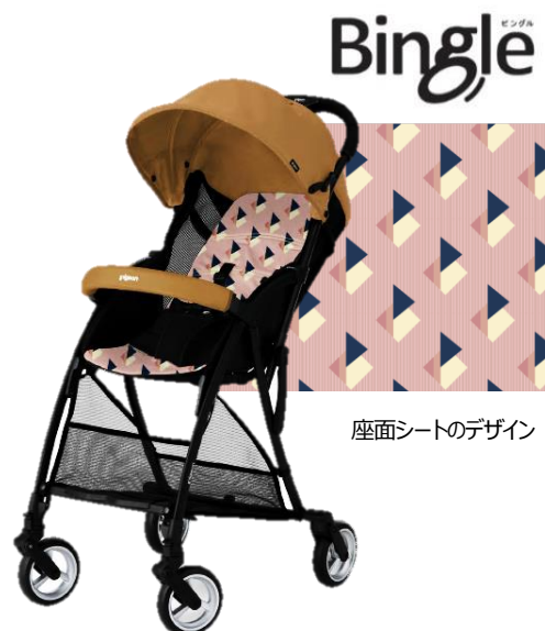
座面シートのデザイン

* 購入者アンケートより「満足している」、「やや満足している」の合計(2019年3月7日~9月9日)