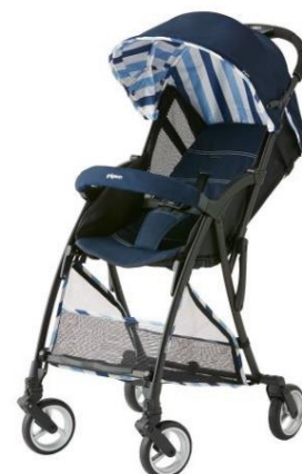
フレッシュネイビー