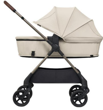
ベージュ (アカチャンホンポ限定カラー)