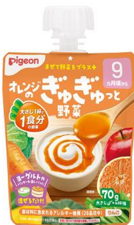
オレンジのぎゅぎゅっと野菜