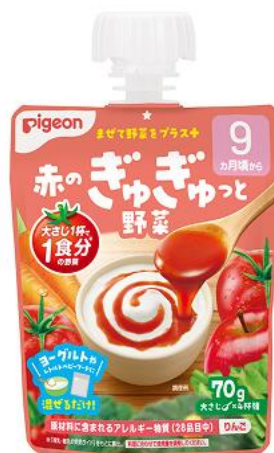
赤のぎゅぎゅっと野菜