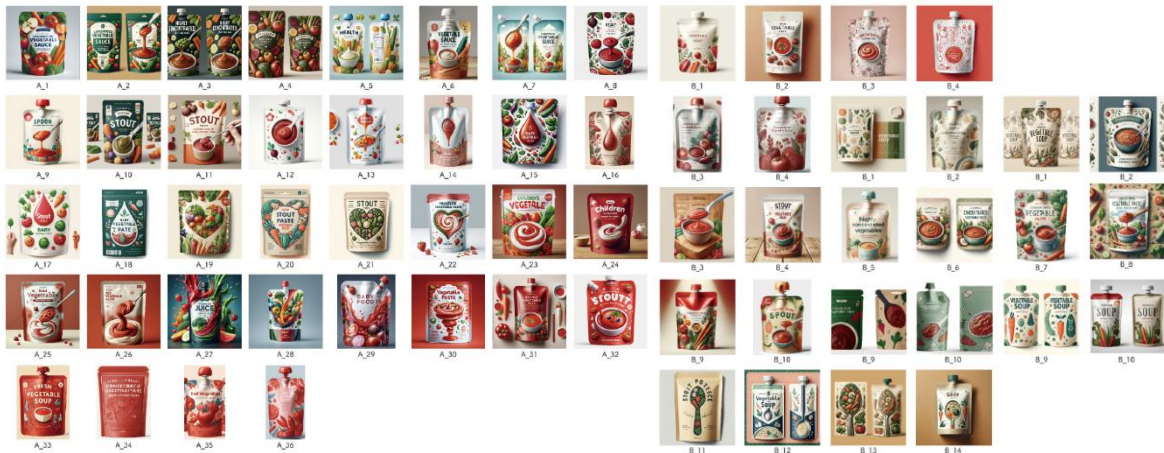
AI が生成したパッケージデザイン案（約100案に及ぶ提案の中の一部）

*デザインの方向性が決まった後は、イラストやデザインをデザイナーが人の手で作り上げていきます。