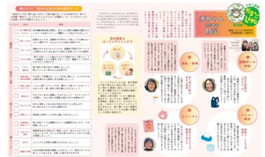
鎌倉市発行の『広報かまくら』

例えば「あかちゃんとそなえの輪」賛同自治体である山梨県大月市では、「子育てと防災の充実」を図ることを目的として、ドラッグストアやこども園と連携し、災害時における支援物資や避難場所の提供に協力する体制を構築しました。★P2に図を掲載